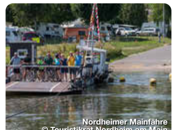
Nordheimer Mainfähre

Alois Alzheimer, geboren 1864 in Marktbreit, beschrieb 1906 eine spezielle Demenzform. Emil Kraepelin benannte diese später nach ihm als „Alzheimersche Krankheit“. Mainstraße 6, Marktbreit