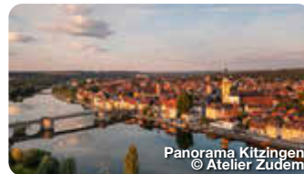
Panorama Kitzingen

Exponate aus fünf Jahrtausenden und vier Erdteilen gibt es im bedeutenden Knauf-Museum zu bestaunen. Die Meisterwerke sind im historischen, ehemaligen Amtshaus in meisterlichen Abformungen ausgestellt. Am Marktplatz, Iphofen