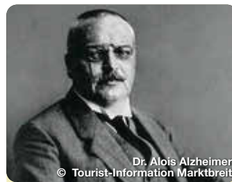
Dr. Alois Alzheimer

Erstmals 889 urkundlich erwähnt, ist Mainbernheim ein Städtchen umrahmt von einem Stadtmauerring mit 18 Türmen und 2 Toren und vorgelagerten Grabengärten. TreffpunktDeutschland.de/mainbernheim