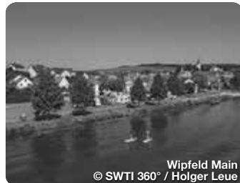
Wipfeld Main