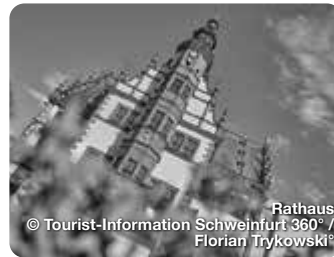
Rathaus Schweinfurt 360°