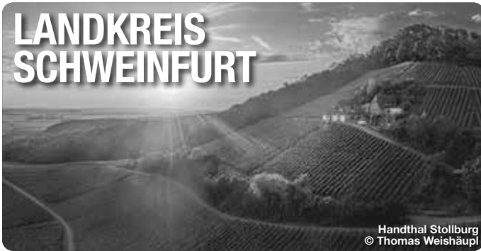
Handthal Stollburg

Alle Termine und Angaben unter Vorbehalt!