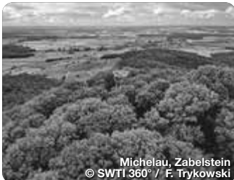
Michelau, Zabelstein

TreffpunktDeutschland.de/schweinfurt-region