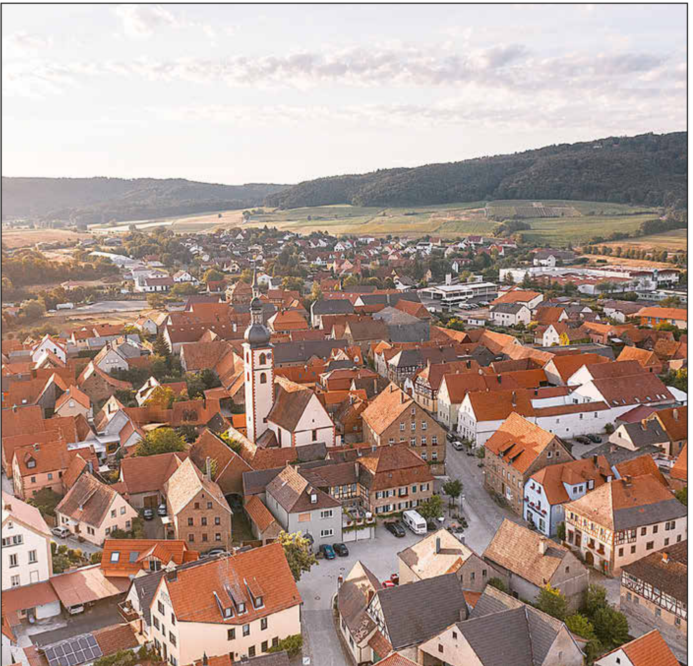
Sonnenaufgang über Abtswind