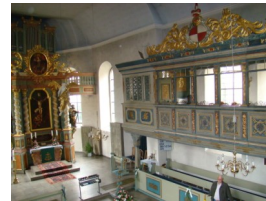
Evangelische Kirche St. Peter und Paul

Altes Gerichtsgebäude, Rathaus und ehemaliges Nachtwächterhaus