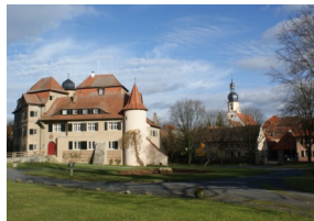
Schloss und evangelische Kirche St. Peter und Paul