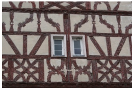
Ehemaliges Centgericht der Grafschaft Castell

Der Ortsname Rüdenhausen hat seinen Ursprung entgegen vieler Erzählungen aller Wahrscheinlichkeit nach im frühmittelalterlichen